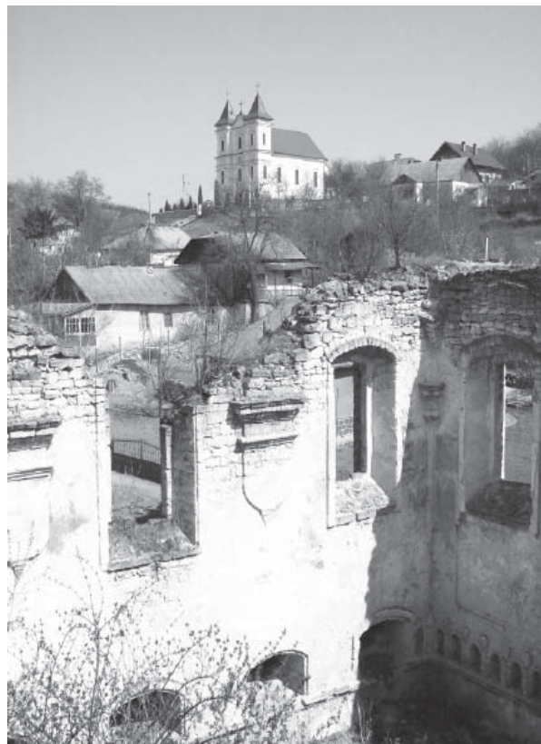
În prim plan, sinagoga din satul Rașcov (sec.XVII), în planul doi biserica catolică funcțională (monument de istorie sec.XVI-XVIII)

Еврейское население известно в Молдове с конца XIV – начала XV в., но в тот период его численность также не была большой. Источниками зафиксировано несколько миграционных волн евреев. Так, в XVI в., в связи с развернувшимся переселением евреев из Германии и Польши, их численность в Молдове возросла. Одновременно в это же время в последней были введены законы, ограничивающие права евреев.