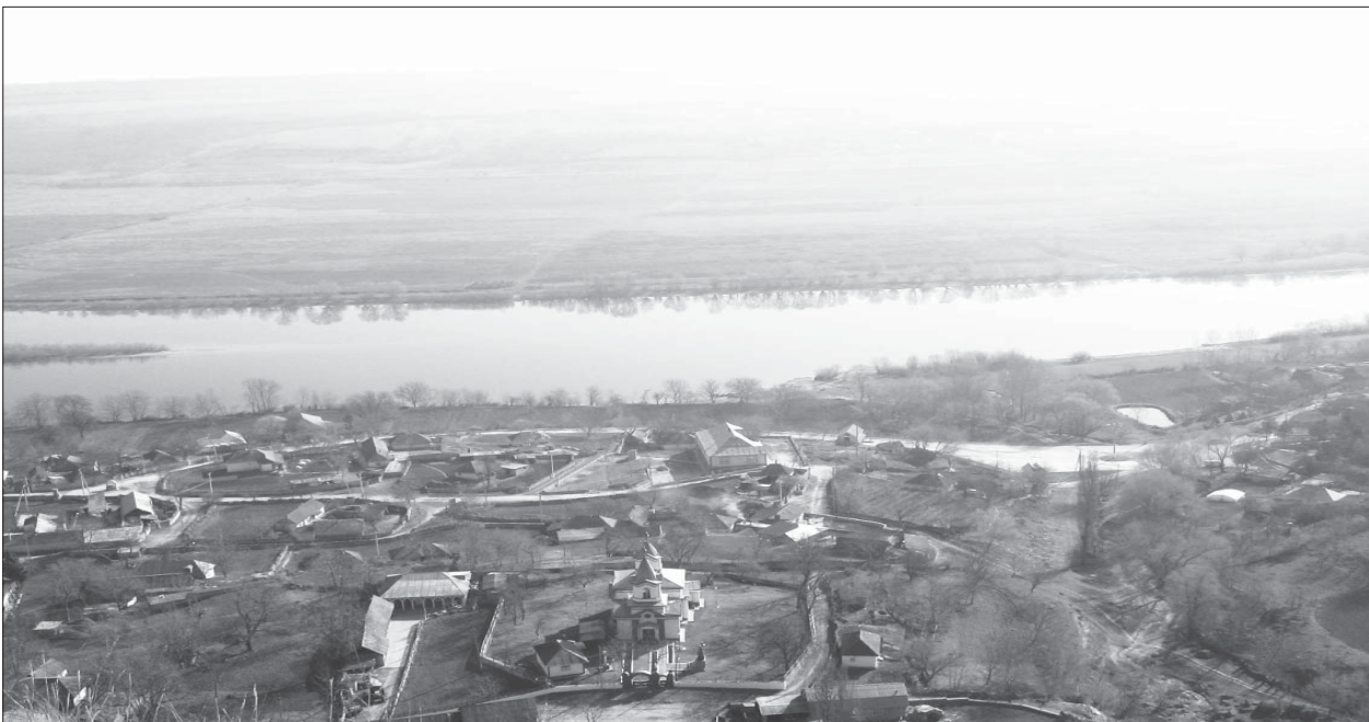
Satele de pe două maluri ale Nistrului, Vadul Rașcov și Rașcov, o zonă străveche interculturală și interconfesională, populată de moldoveni, ucrainenii, polonezi, evrei

В Левобережных районах Днестра, входивших в состав так называемой «Ханской Украины» и владений польской короны, в конце XVIII в. преобладали молдаване. В последнем десятилетии XVIII в. эти земли вошли в состав России. По данным V ревизии (1799 г.), в Очаковской области было учтено около 19 000 молдаван, которые составляли 39,12% жителей области. В первой половине XIX в. в ходе демографических изменений численность молдаван постепенно возрастала, но их удельный вес постепенно уменьшался в связи с украинско-русской колонизацией Новороссийского края.